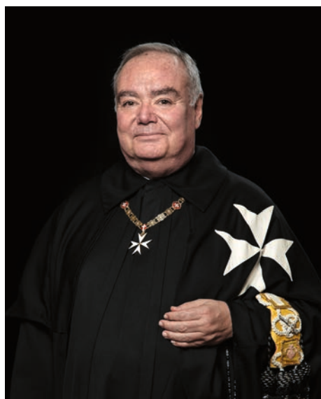
Le Grand Maître, S.A.E. Fra' John T. DUNLAP

L'Ordre de Malte œuvre à travers dix Prieurés, cinquante Associations nationales, cent trente et une missions diplomatiques, une agence de secours internationale et quarante-cinq corps nationaux de bénévoles, en plus des nombreux hôpitaux, centres médicaux et fondations spécialisées. L'Ordre de Malte ne poursuit aucun but économique et politique et ne dépend d'aucun Etat ou gouvernement.