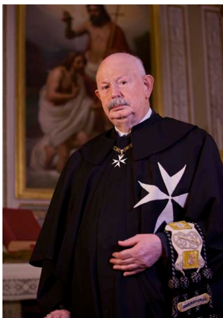
Grand Maître Fra' Giacomo Dalla Torre del Tempio di Sanguinetto 9 décembre 1944 - 29 avril 2020

Fidèle à sa vocation, l'Ordre Souverain de Malte continue aujourd'hui dans plus de 120 pays son service d'assistance aux malades, aux pauvres et aux déshérités. L'Ordre Souverain de Malte est présent dans de nombreux secteurs d'activité tels que l'assistance médico-sociale, les secours aux victimes de conflits armés ou de catastrophes naturelles, les services d'urgence, la gestion d'équipes de premiers secours, l'assistance aux personnes âgées, aux handicapés, aux enfants en difficulté, l'enseignement, les cours de formation de secourisme, des actions d'intervention en faveur des réfugiés et des migrants. Depuis plus de 900 ans, l'Ordre Souverain de Malte agit en toute neutralité dans le monde sans distinction de race, d'origine ou de religion.